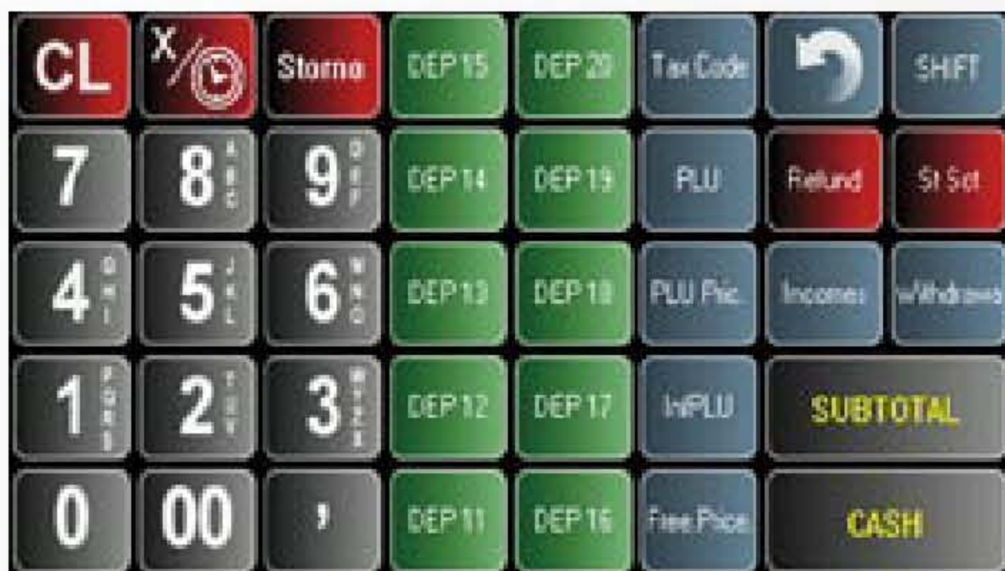
Tastiera programmabile e personalizzabile