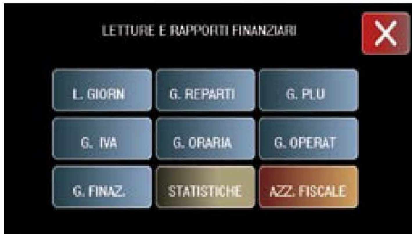
Letture rapporti finanziari con azzeramento fiscale immediato